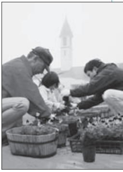
咲かせよう おもてなしの花キャンペーン (東酒屋町)

11月15日(土)、広島三次ワイナリー芝生広場で、「咲かせよう おもてなしの花キャンペーン」が行われました。この活動は、三次市観光キャンペーン実行委員会が、三次を訪れてくださる方に気持ちよく過ごしていただくよう行っているもので、今年で3回目を迎えました。 市内の企業や団体などからボランティアの参加があり、約550鉢に色とりどりのビオラの苗が植えられました。これらは、主にワインロード沿いに設置され、沿道を彩る花々が三次に来られた方を温かくお迎えしています。