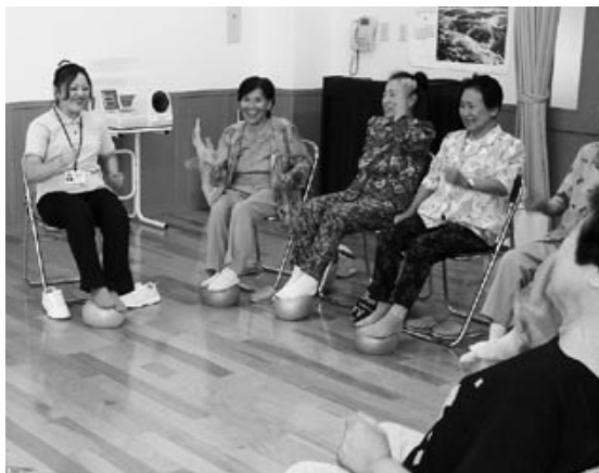
介護予防のための「元気ハツラツ教室」

また、今年度に入り特別養護老人ホームでは、30床の増床計画目標を達成しました。さらに、小規模多機能型居宅介護やグループホーム、高齢者専用住宅などの新しい施設も建設されています。現在、事業所やそこで働いておられる方、高齢者の方にアンケート調査を実施しており、来年度には新たな高齢者施策について発表できると思いますのでご期待ください。