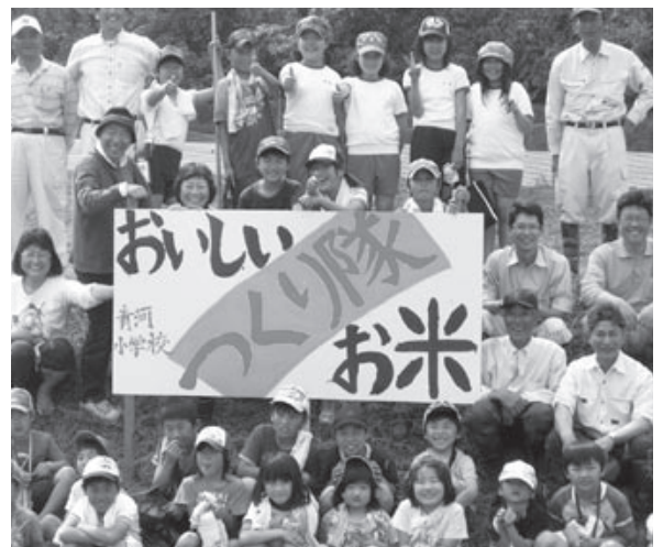
〈元気な青河小学校の児童〉

この活動は、テレビや新聞などでも注目され、都市から青河に移り住まれた人は、現在では、10世帯36人います。地域みんなと和気あいあい一緒になって、楽しいまちづくりを進めています。