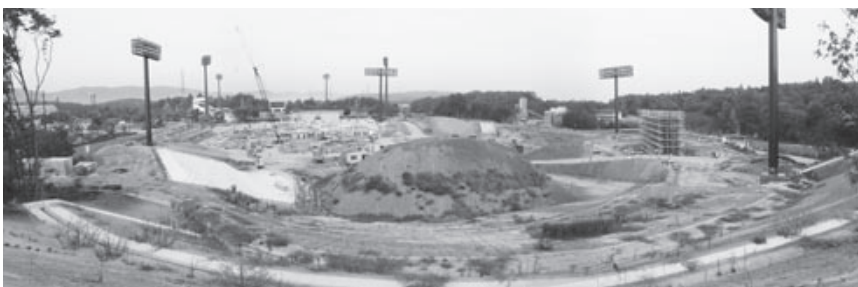
工事の進むみよし運動公園野球場施設

新野球場の建設に関わる一番の課題は、ランニングコストです。建設費用は、合併特例債や補助金などの国の助成があるため、市の持ち出しが少なく済みます。しかし、ランニングコストは、100%一般財源で補填しなければなりません。こうしたことから、子どもたちの身体的影響も充分に考慮に入れながらランニングコストが天然芝よりも安い人工芝に決定しました。