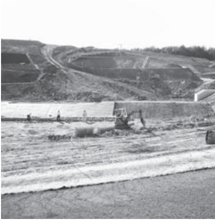
造成工事の進む三次工業団地（Ⅲ期）