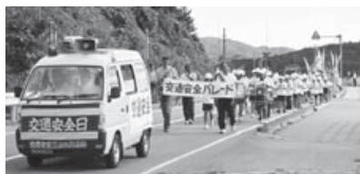
青パトの先導で第30回交通安全パレード

また、青少年育成に関するニュースを「自治連だより」に掲載し、地域全体での青少年育成に取り組みんでいます。