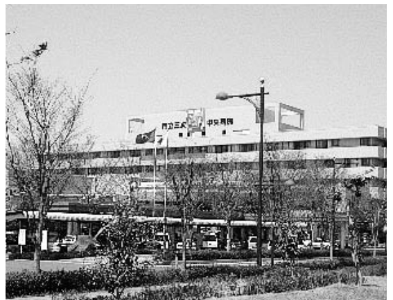
市立三次中央病院

回答 市立三次中央病院は地域の中核病院であり、急性期医療を担う「急性期病院」として、地域の開業医との連携を強化する取り組みを行っています。「急性期病院」とは緊急、重症の方を中心に、入院や手術・検査など、高次で専門的な医療を行う病院のことです。そのため、急性期の治療を必要とする場合は、当院の地域連携室を通して受診していただく地域連携システムの構築に努めて