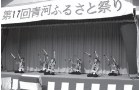
〈青河ふるさと祭り〉

青河地域は、三次市の南西部にあり、粟屋町、西酒屋町、下志和地町に隣接し江の川とその支流の小似川 いかわ の沿岸に広がる地域です。