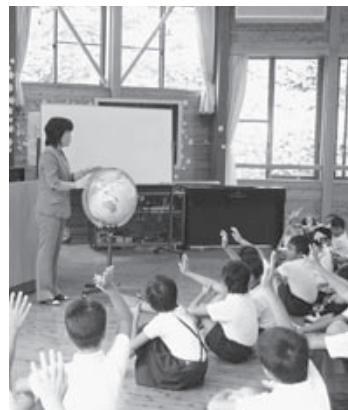
作木小学校での学校版環境ISOの様子

現在、市内には400人以上の従業員を抱える優良企業がありますが、工業団地だけでなく、三次に帰ってきた若者が安定した生活を確保できるような取り組みが重要であると考えています。