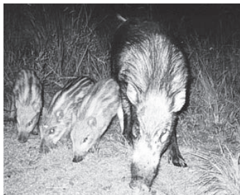
田畑を荒らすイノシシ

また、有害鳥獣のさらなる捕獲などについては、来年開催される三次市有害鳥獣駆除対策協議会に諮り、取り組みを進めていきます。未然防止策として、効果的な防護ができる方法をお知らせする講習会も計画するようにしていますので、ぜひ、参加をお願いします。