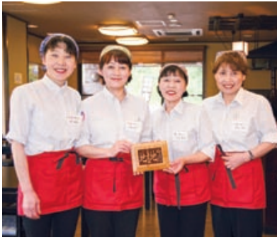
スタッフの皆さん

お店に飾られる花は、君田の四季をお客さん感じていただきたいと、スタッフの皆さんが毎朝摘み取ってこられるもの。観光地でもある君田温泉森の泉は、市外からのお客さんも多く、季節の花は店内にどくと構える囲炉裏とともに、懐かしくほっとする空間をつくり出しています。 地産地消の店に認定され、スタッフのメニュー紹介にも自信がついたそうです。「君田産のお肉や野菜ですよ」と