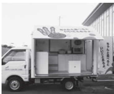
出前講座にも登場するキッチンカー

また、食育出前講座では、旬の食材をふんだんに取り入れたメニューを活用し、身近に地産地消に取り組んでいたかどうかと啓発を行なっています。ぜひ、皆さんの地域でも活用してください。