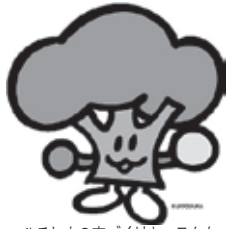
ひろしまの森づくりキャラクター「モーリー」