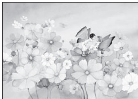
〈コスモスパーク〉1983年