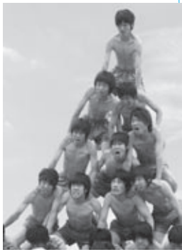
三次高等学校創立 110 周年記念 体育大会 (みよし運動公園)

今年で創立110周年を迎える三次高等学校では、6月15日(日)記念の体育大会が行われました。みよし運動公園で行われた大会には、若人の熱い雄姿を見ようと大勢の保護者や関係者が詰めかけました。 組体操やダンス、応援合戦と持てる力を精いっぱい出して取り組む生徒の姿は、見ている人に感動を与えました。