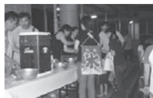
昨年の映画上映会での様子

今年も小学校PTAの協力によりかき氷を用意します。 とき 8月1日(金) 午後7時20分