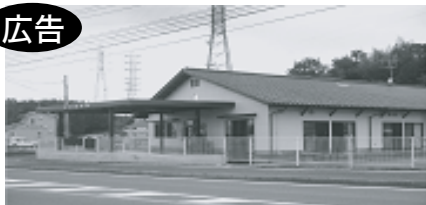
三次相扶園 ナフコ前 国道375号沿