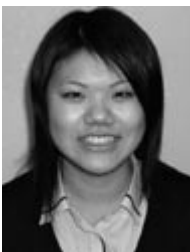
三次青陵高等学校 3年生