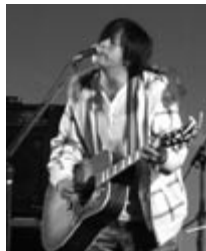
日影館高等学校 3年生