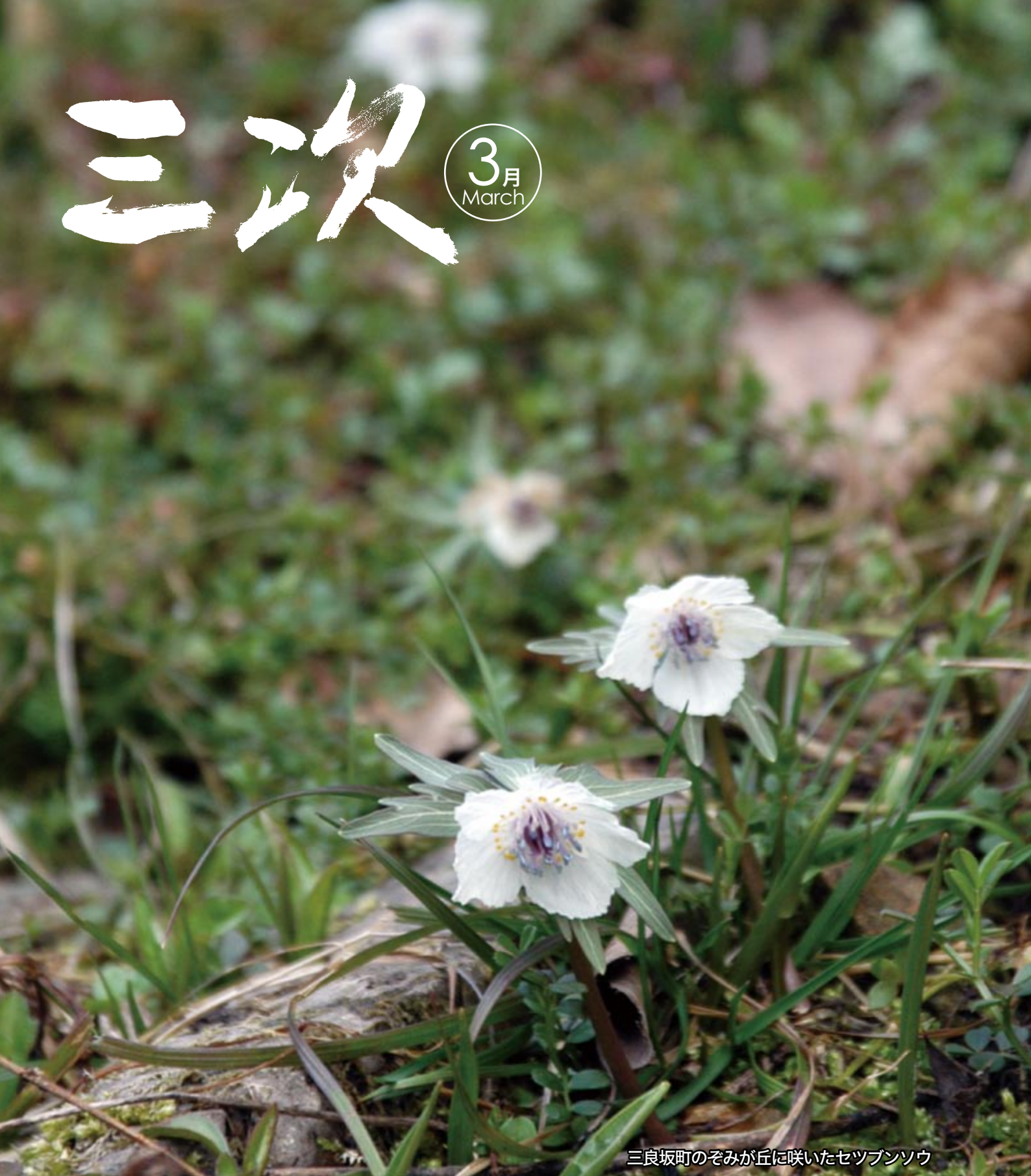
三良坂町のそみが丘に咲いたセツブンソウ