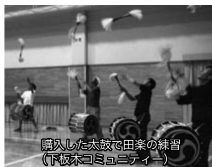
購入した太鼓で田楽の練習(下板木コミュニティ)

財団法人自治総合センターは、宝くじの普及広報と、地域文化の振興や地域コミュニティの健全な発展を図ることを目的として助成活動を行っています。今年度は次のとおり助成を受けました。 これを機に、地域の活動がますます盛んになっていくことでしょう。