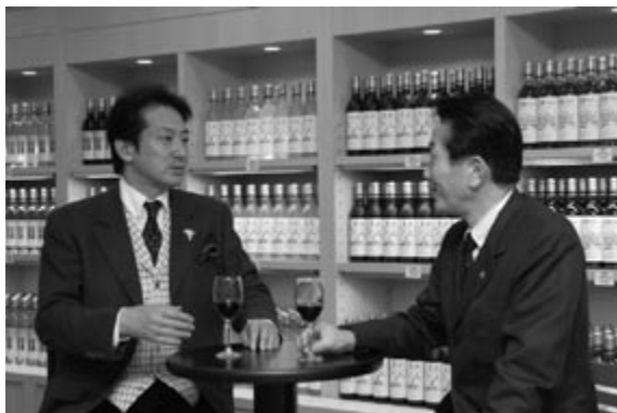
広島三次ワイナリー試飲コーナーで(辰巳琢郎さん)

2月9日(金)、広島三次ワイナリーで開催された「マイスイートバレンタインwith辰巳琢郎&国府弘子」では、辰巳さんのワイン講座や国府さんのジャズピアノライブ、そしてディナーを、130人余りが堪能。東広島市など市外から来られた方も多く、日常とは違う時間を楽しめましたようです。