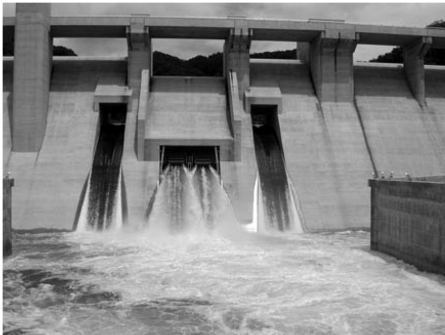
環境用水放流設備から放流を行っている様子

※放流の画像は携帯サイトでもご覧頂けます。 (灰塚ダム情報) http://www.haizuka.go.jp/i/