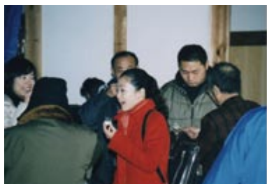
▲3年前から行われる年1度の蔵開放。地元の人に親しんでもらおうと始めたが今では広島から来られる人も。