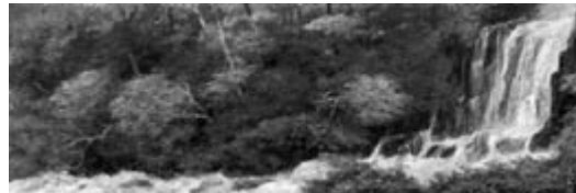
奥田元宋《溪澗秋耀》