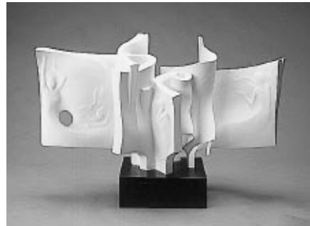
「或るページ」昭和47(1972)年

小由女先生は「私は人形をつくることよりも、何かを写すことよりも、何か自分自身の心と夢のような