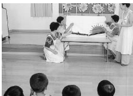
川西保育所での手づくり布絵本 読み語り

訪問や健診・相談・地域での交流活動等を通じて、子育てのお手伝いをしています。気軽に声をかけてください。