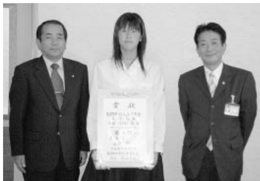
校長とともに市長へ入賞報告をされました。