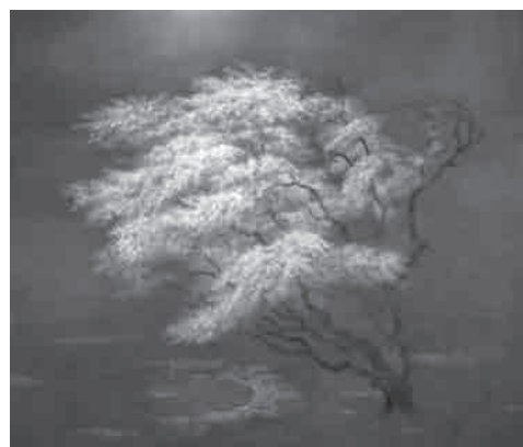
奥田元宋《寂静》昭和61(1986)年

※高校生以下、身体障害者手帳など所持者は観覧料無料 ※( )内は20人以上の団体