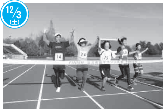
3000mの部1組[一般・女子(中・高校生)]で、手を取り合ってゴールする皆さん