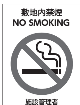
施設管理者 <表示例>