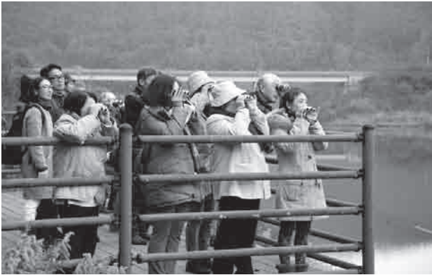
展望所で双眼鏡を構え水鳥を観察する参加者の皆さん