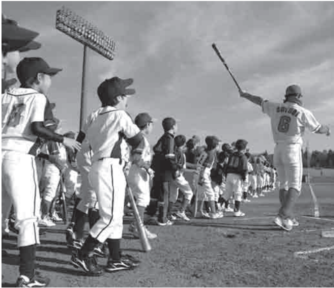
梵選手の打球の行方を追う子どもたち