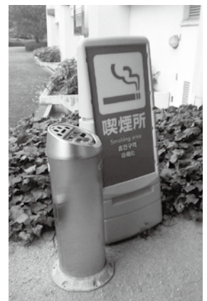
みよし運動公園喫煙所

市内公共施設敷地内全面禁煙について、平成29年度内100パーセントの目標を達成できるのか。未達成の