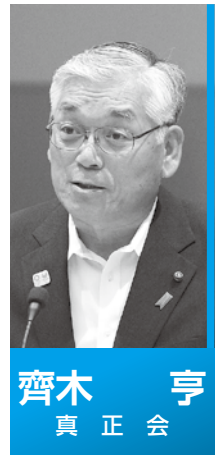
齊木 亨 真正会