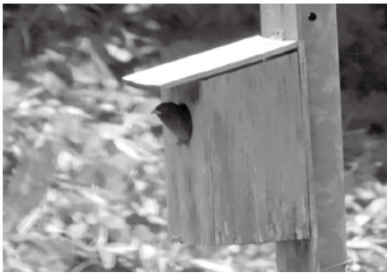
巣立ち直前のブッポウソウ：作木町

増田市長 希少動植物保護の必要性について、市民の機運をどう高めていくかが課題ととらえており、今年度もどのように機運を高めるか取組を進めていく。条例制定は、ヒアリングをさせていただいた方のご意見を十分取り入れていき、今年度中に条例案を検討し、議会へ提出していきたい。