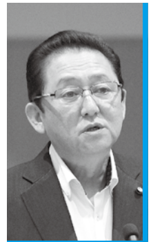
保 治 清 友 会