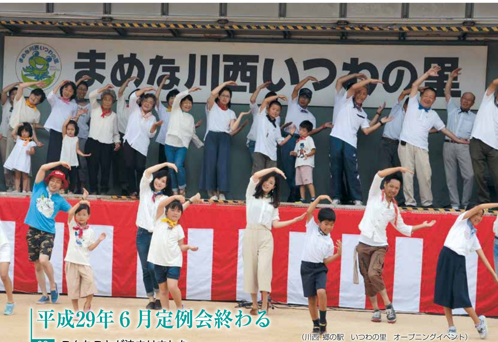
(川西 郷の駅 いつわの里 オープニングイベント)