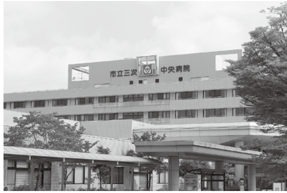
市立三次中央病院