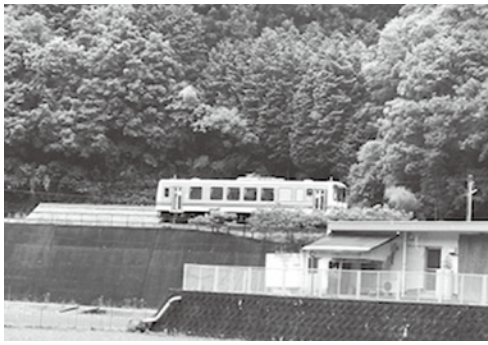
伊賀和志駅に入るディーゼルカー

三江線代替バスの運行に代わると、JRに比べ、通学費用が高額になると想定される。全市的にバス通学に対する補助の考えはないか。また、三次青陵高校生との意見交換会の折り、生徒から出された意見から塩町駅から三次駅方面の列車ダイヤの増便はできないか。