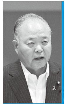
横光 春市 眞 正 会