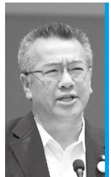
重信 好範 清 友 会