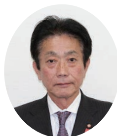
吉岡広小路 (三次志士の会)