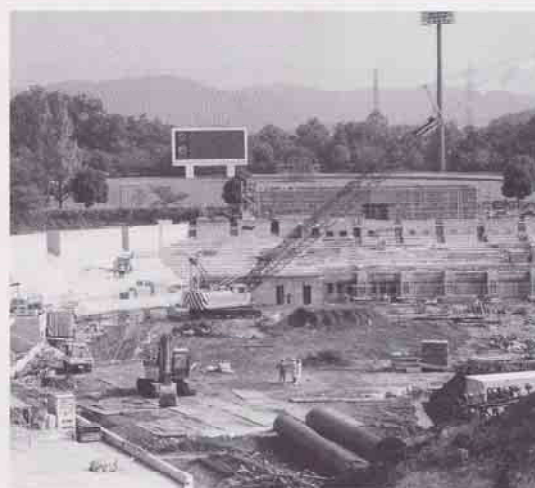
みよし運動公園野球場 工事風景