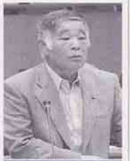
池田 徹 三 起 会