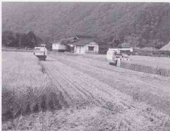
農事組合法人「海渡」(海渡町)

今年度は海渡、石原町の配水管と海渡配水池、海渡ポンプ所の実施設計業務を行い来年度から工事着手、平成27年度末までに完成する計画である。上田町については、飲用水施設補助(ボーリング補助)を活用していただきたい。