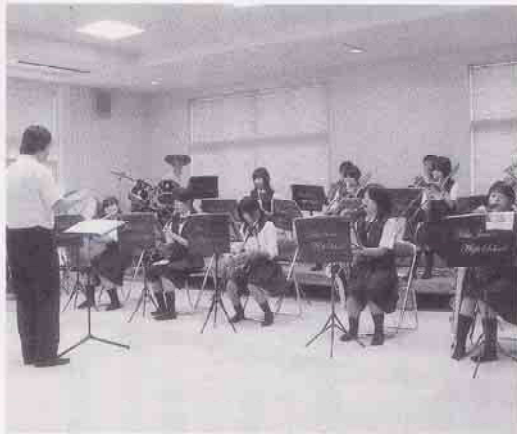
吉舎中学校 吹奏楽部

文化、体育も含め今後保護者の負担が大きく増大したり不均衡にならないよう実態に応じた基準の見直しを進める。