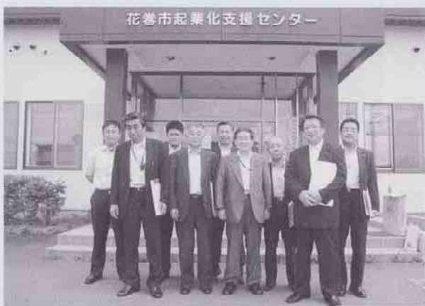
花巻市起業化支援センター