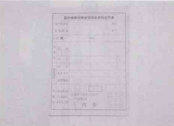
国民健康保険被保険者資格証明書

資格証の交付は、平成12年度から義務化され、国の基準に基づき納期到来後1年を経過した滞納者に対し、原則として資格証を交付している。