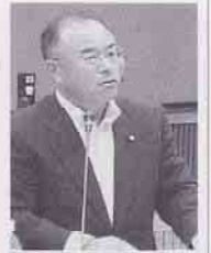
戸 稔 清友会