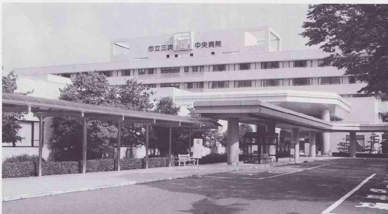
市立三次中央病院