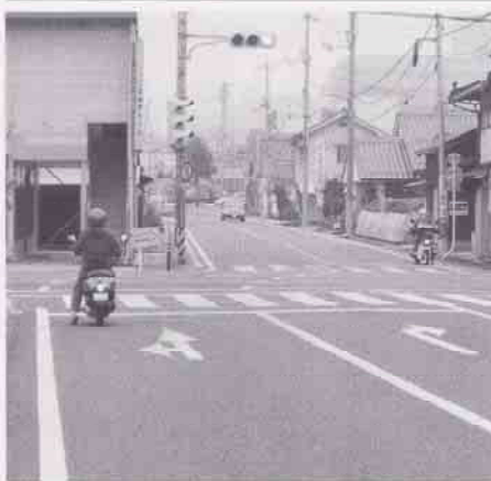
上原北交差点(十日市東)

平成23年度完成をめざして三次河川国道事務所と協議を進めている。上原交差点から上原北交差点までのR375の区間の改良については、県に同時