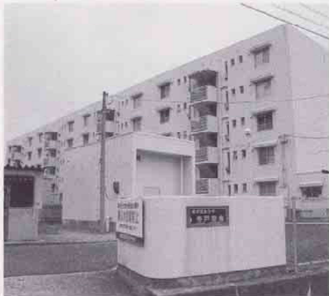
寺戸雇用促進住宅(三次町)

市内5カ所の雇用促進住宅については、雇用・能力開発機構広島センターから譲渡の意向の有無について文書で依頼があった。譲渡を受けた場合の将来の費用負担や現入居者の居住の確保、地域の住宅事情など総合的に検討をしている。