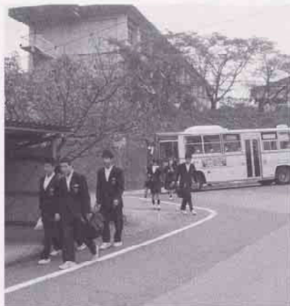
塩町中学生のバス通学

した大変重要な交通機関であるバス会社の撤退の話を聞くが、経過と今後の対策を伺う。また、昭和46年に川西中学校と塩町中学校の統合により、バス通学となったが今後はどうなるのか。