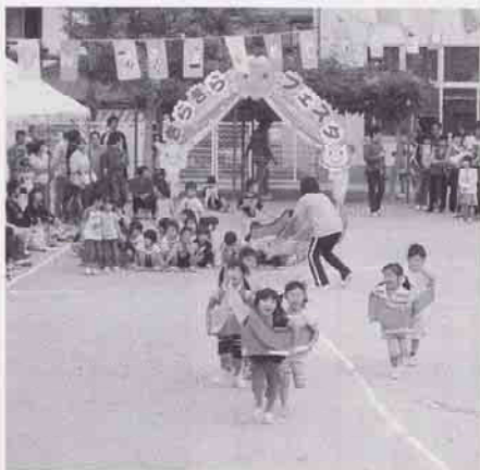
東光保育所運動会(四拾貫町)

の意向あるいは保護者会、保育士など現場が混乱しないよう対応していた。小学館とも協議を行っていたわけのことさら意図的に隠したのではない。