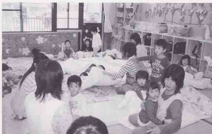
愛光保育所(三次町)

配置すべきものである。厳しい財政事情の中、行財政改革推進計画、後期計画の策定に併せて定員管理計画の変更も必要になるかもしれない。将来的な児童数、財政など市全体の問題として保育士の採用も考えていく。