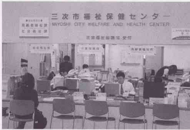
三次市福祉保健センター