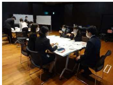
新規採用職員特別研修の様子