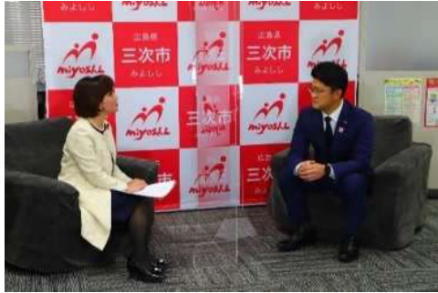
市長が語る市政広報番組