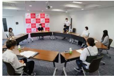
成人式実行委員との懇談会