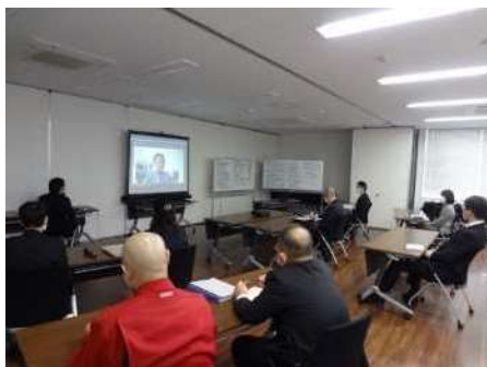
課長級職員人材マネジメント研修の様子