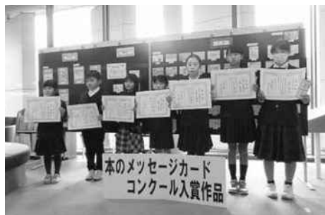
三次市立図書館 本のメッセージカードコンクール