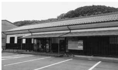
三次市立布野図書館