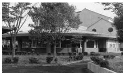
三次市立三和図書館