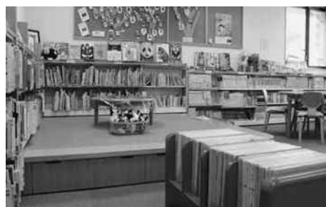
三次市立君田図書館