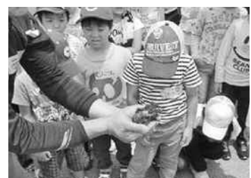
カブト虫の幼虫探し