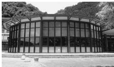
三次市立作木図書館