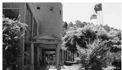
三次市立甲奴図書館