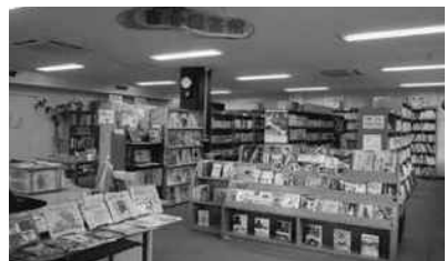
三次市立吉舎図書館