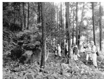
文化財パトロール (指定文化財の調査・確認)