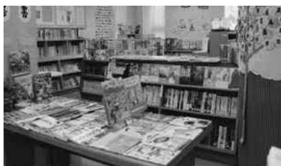
三次市立三良坂図書館