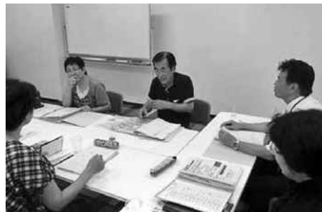
社会教育委員会議

三次市社会教育委員としてこれまで「家庭教育に関する提言書」「三次の子育て5か条」を作り啓発活動を行ってきました。これまでの活動を生かし、各団体との交流により「子育て教育と家庭支援のあり方」について意見交流を行い、行政や他機関と連携して取組む家庭教育支援体制の構築について議論しました。