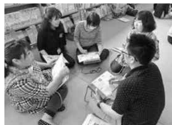
小学校保護者の「親プロ」講座

② 『『親の力』をまなびあう学習プログラム(略称：親プロ)』ファシリテーター養成講座の実施