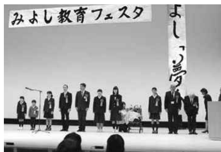
「わが家の1か条」募集表彰式

また、全校生徒が応募した学校が2校あり、応募作品数も303作品と、多数の応募があり入賞作品の表彰を行いました。