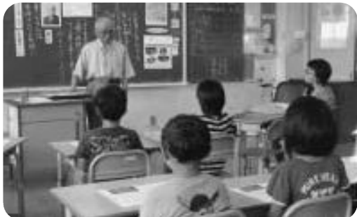
ふるさとの心に学ぶ道徳の時間