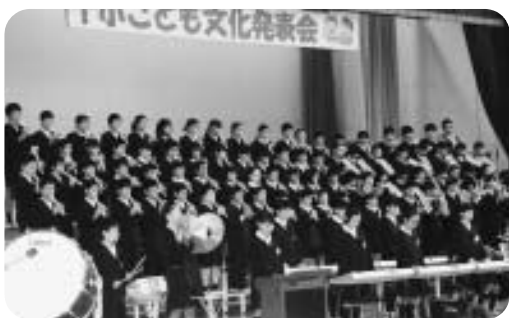
十小子ども文化発表会（6年「合奏」）