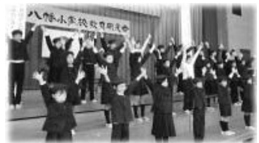
オペレッタ「八幡の四季」