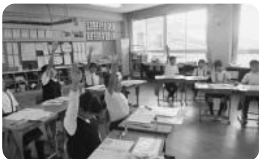
社会科の授業風景