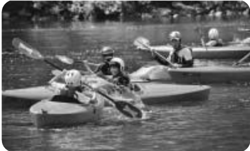
野外活動江の川カヌー公園