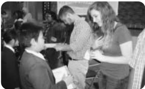
小中一貫教育連携 アメリカス市訪問団との交流