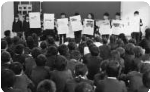
わかりやすい表現