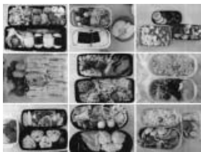
平成26年度 年3回「子どもが作る弁当の日」の取組より