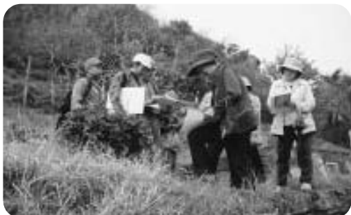
安田子ども自然ガイド