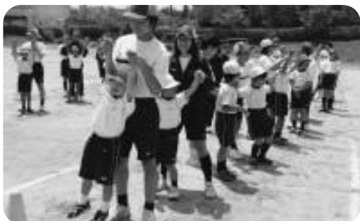
小中合同チャレンジデーの実施