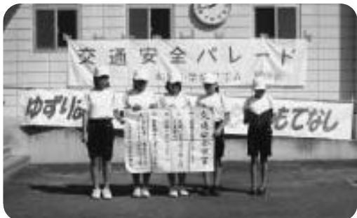
交通安全パレード