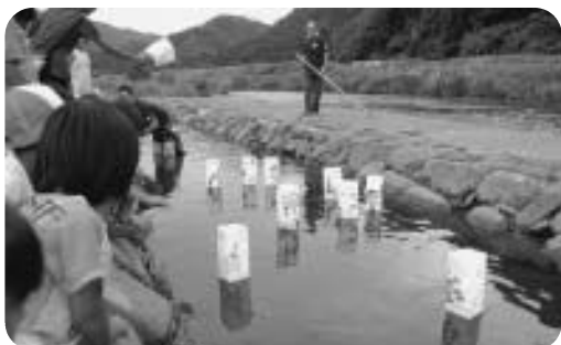
ウォーターランド祭り