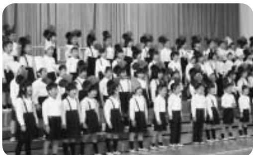
音楽発表会 ～心を合わせて～