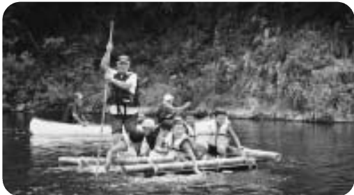
「山・海・島」体験活動での西城川でのいかだ下り