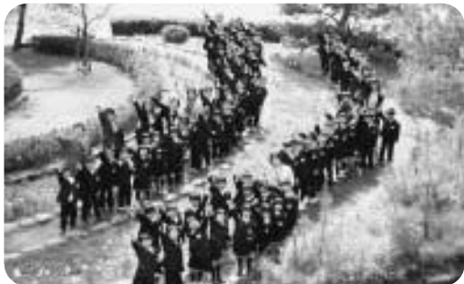
「七本松」と共にスタートしています