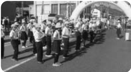
きんさいパレードへの鼓笛出演