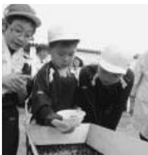
米作り体験活動 初まき