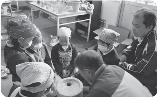
地域とのふれあい