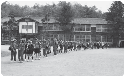
新入生歓迎全校遠足(比治山学園・からまつ寮へ)