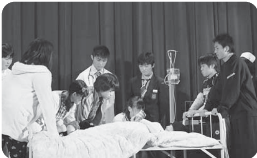
文化祭でのクラス劇