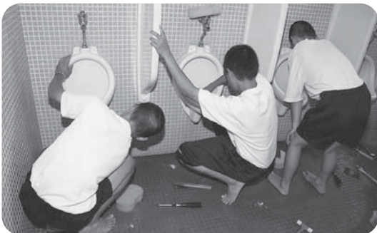
十中を美しくする会