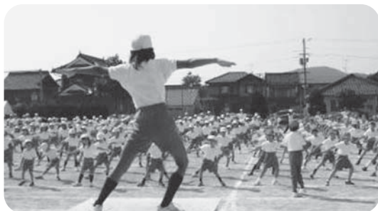
三次小オリジナル体操「宙船」(そらぶね)