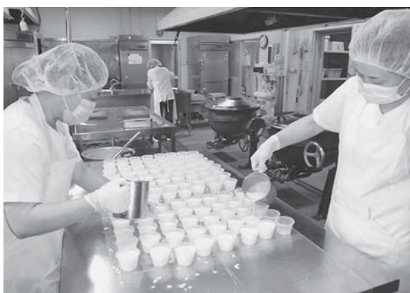
大人気手作りデザート

13カ所の調理場の学校栄養職員等は、それぞれの地域性に配慮した独自の献立を立てています。