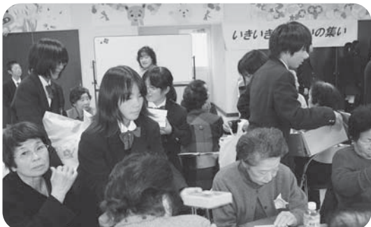
いきいきふれあいの集い（ボランティア活動）