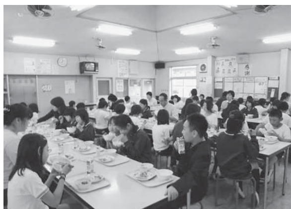
食堂で楽しい給食