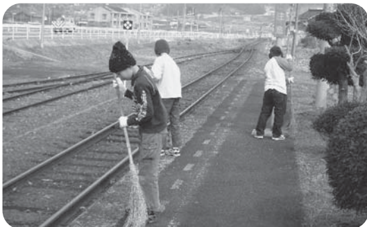
クリーン活動（安田駅の清掃）