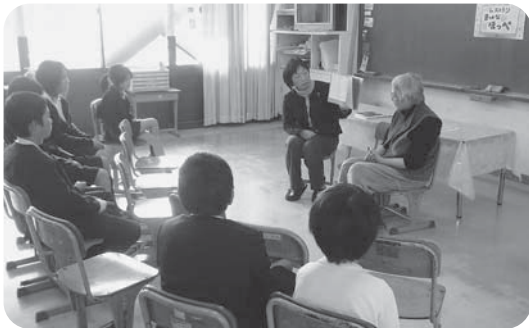
読書ボランティアさんによる本の読み聞かせ