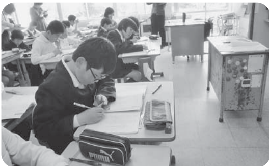
書くことを重視した国語科授業