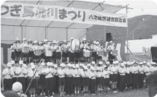
馬洗川祭での鼓笛演奏