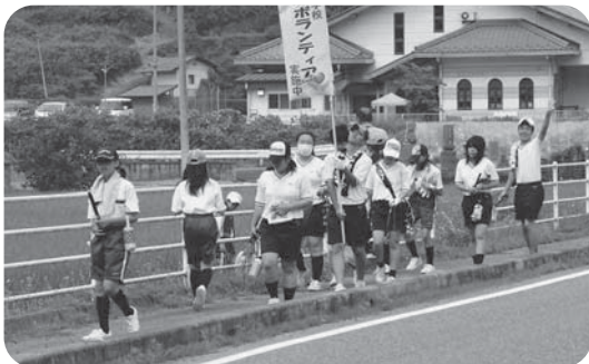
地域清掃ボランティア