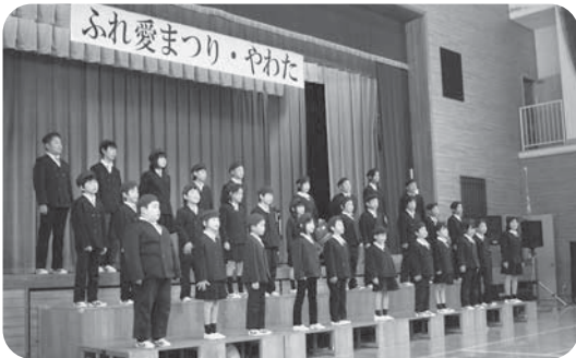
オペレッタ「八幡の四季」