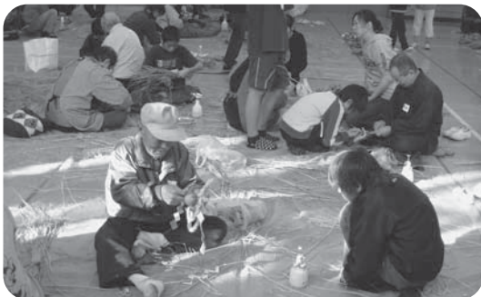
地域の方を招いてのふれあい活動