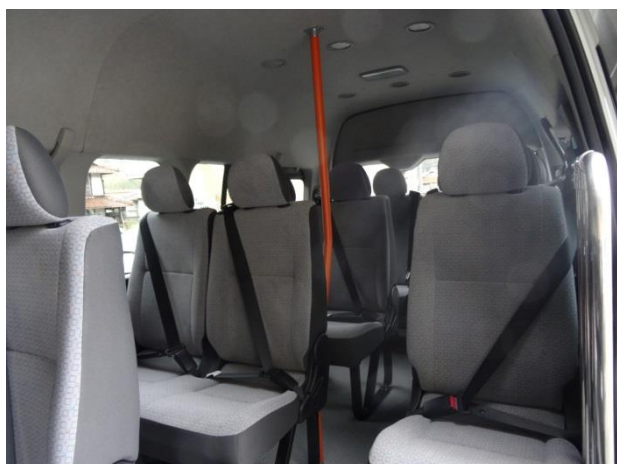
車の様子：車内の様子