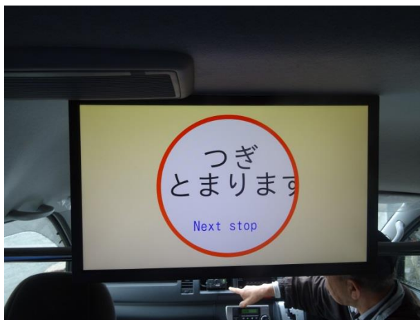
車内の様子：停車告知