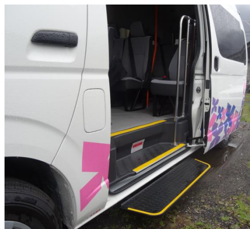
車の様子：ステップ