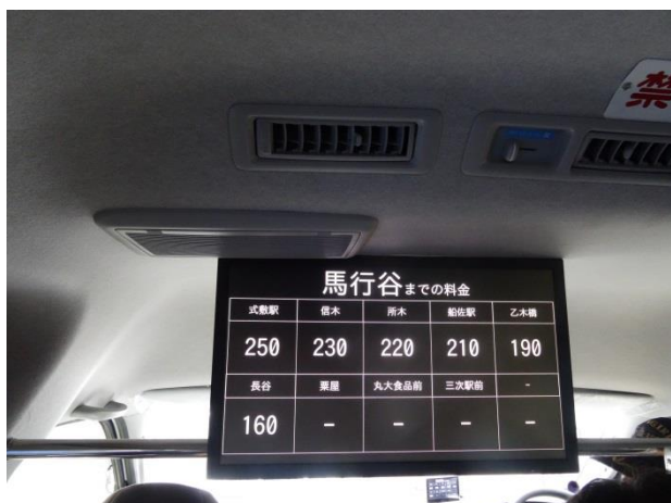
車内の様子：運賃表