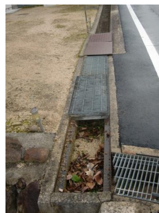
(土砂や枯葉の堆積)