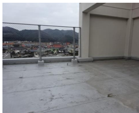
【フラットルーフ（陸屋根）】