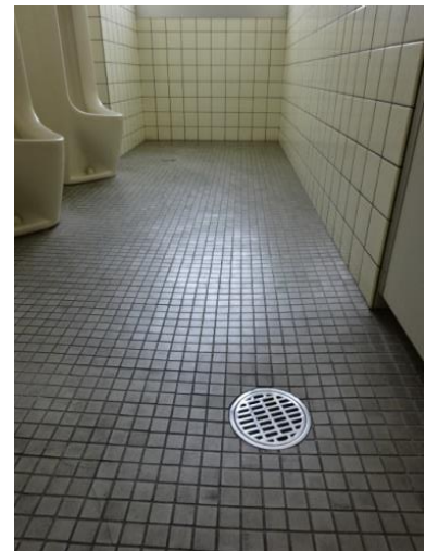
（床面の水洗いは控える）