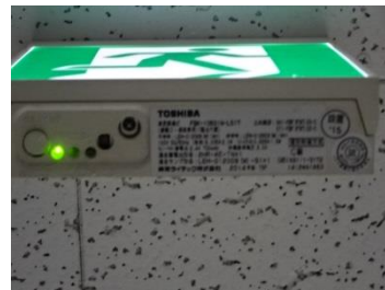
（モニタランプの緑点灯を確認）

※ モニタランプが点灯していない，点検用の引き紐を引いた状態でモニタランプが点灯していない場合は，バッテリーの不良なので交換してください。