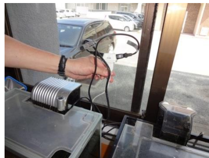
(プラグのたこ足配線)