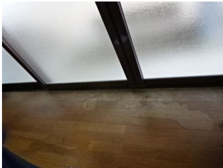
(結露による床損傷)