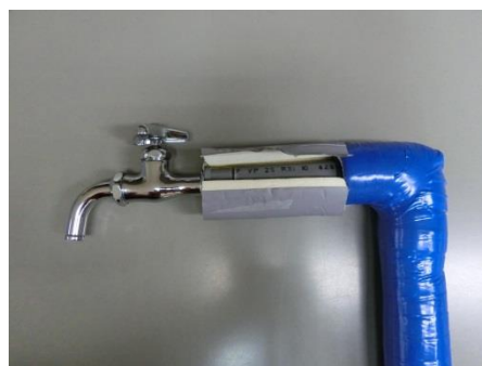
（保温材による水道管の保護）