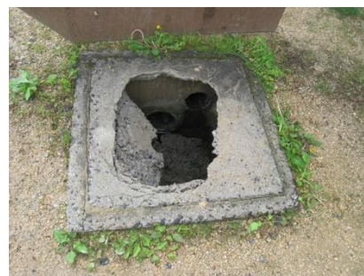
ますふた (柵蓋の破損)