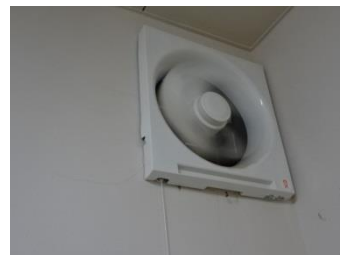
(正常に作動しますか?)