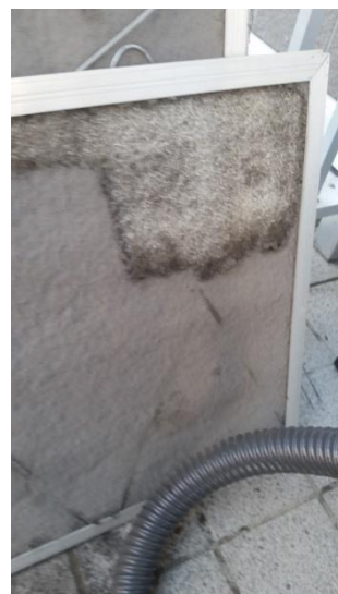
(フィルターに付着したほこり)

※ フロン排出抑制法に基づき、簡易点検（記録）を3か月に1回以上行うことが義務づけられています。