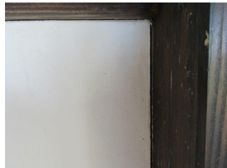
(壁と柱の間にできた隙間)