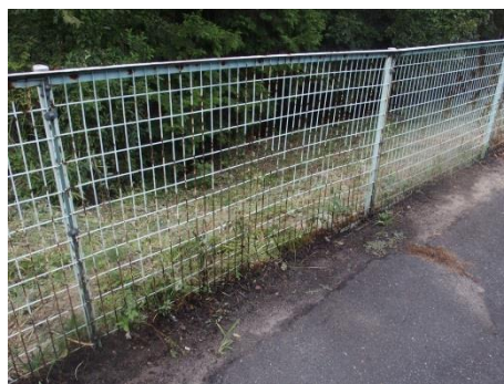
（フェンスに発生したサビ）