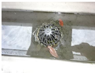
（屋上排水口に溜まった水）