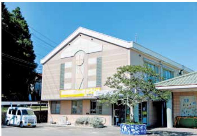
田幸コミュニティセンター

私たち、一人ひとりの努力で誰もが安心して暮らしやすい魅力的で持続可能なまちづくりをめざしていきましょう。