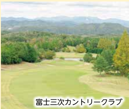
富士三次カントリークラブ