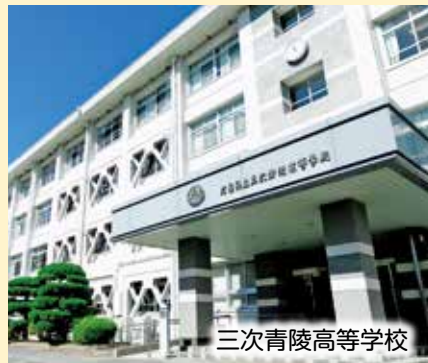
三次青陵高等学校