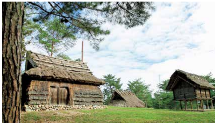
みよし風土記の丘