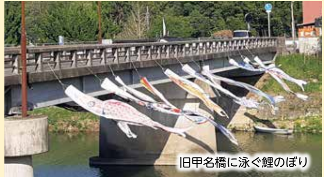
旧甲名橋に泳ぐ鯉のぼり