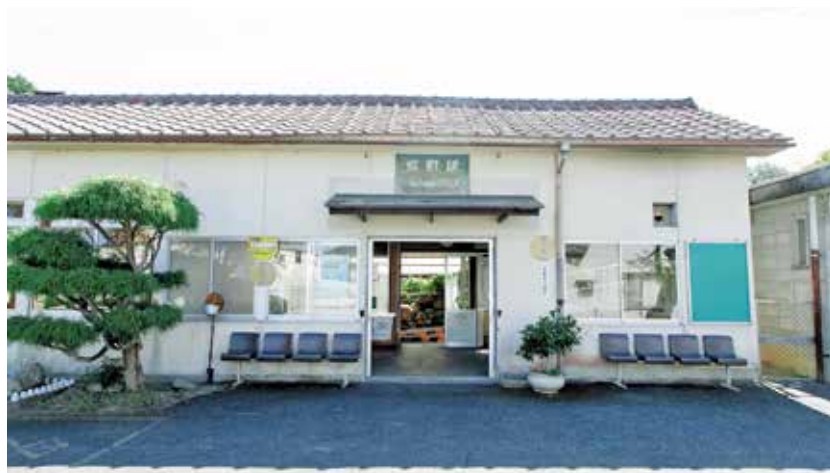
J R 塩町駅