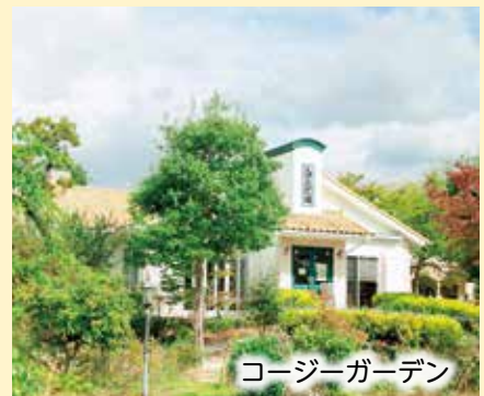
コージーガーデン