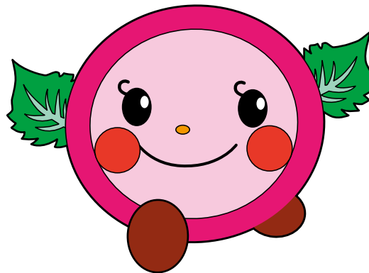
田幸まるごとちゃん

※このイメージキャラクターは、2006年度（第21回田幸農業文化祭）において3点の候補作の中から選んでいただき、決定したものです。「田幸まるごとちゃん」は、愛らしく温かみを感じるイメージで制作されたものです。