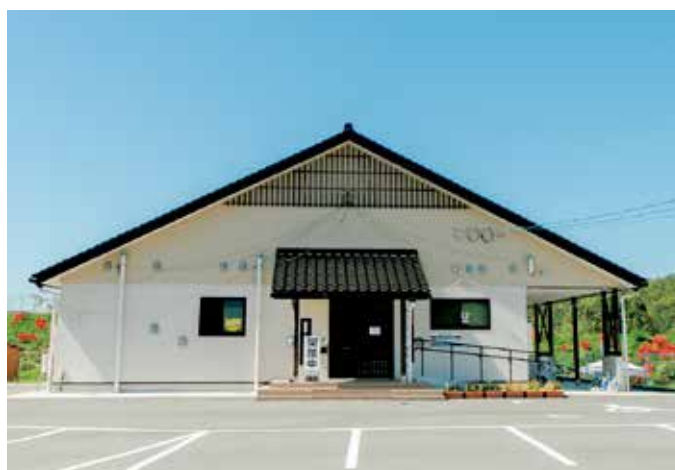
いきいきランド田幸