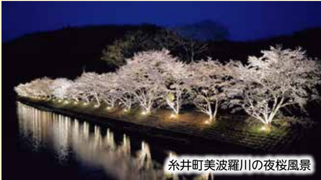
糸井町美波羅川の夜桜風景