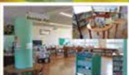
リーディングホール