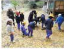
遊具神社での秋見つけ