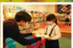
君田図書館との連携