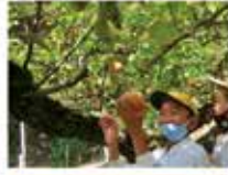
高丸農園 梨の収穫体験