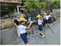
ブッポウソウの保護活動