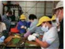
森の学習（植林体験）