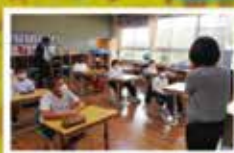
ブックトーク朝会