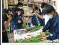
「パンダ」農園体験学習