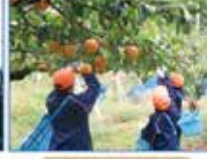
高丸農園体験学習