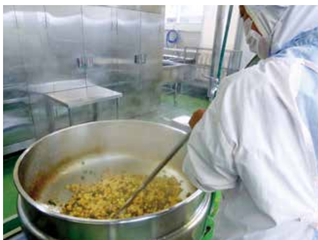
大釜での調理風景