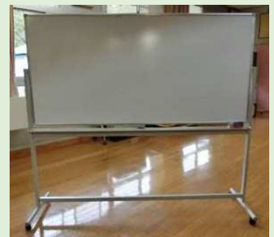
過去に購入したホワイトボード