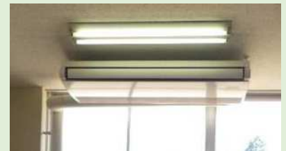
過去に設置した空調機