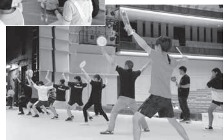
体を動かそう！ 三次どんちゃん体験 (市民ホールきりり)

問 三次市チャレンジデー実行委員会事務局(観光スポーツ交流課スポーツ交流係内) ☎0824-62-6553 FAX0824-62-6235