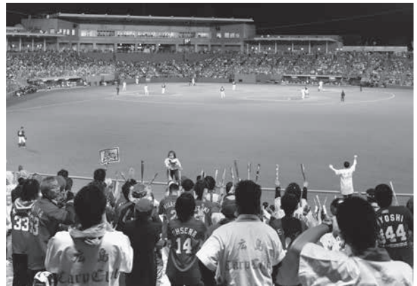
声援を送るカープファン

中 日ドラゴンズを三次で迎え撃ちました。5年連続で入場券は完売し、カープファンで真っ赤に染まった超満員の球場は、熱気に包まれました。試合は3対2でカープが勝利。カープは今季初の単独首位に立ち、球場は大いに盛り上がりました。