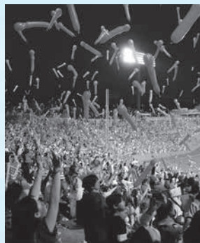
プロ野球公式戦の様子

三次は中国地方の「ど真ん中」。拠点性、中枢性を遺憾なく発揮し、素晴らしい施設や資源を利活用することで、三次の魅力を更に発信し、元気づくりに繋げていきたいと考えています。