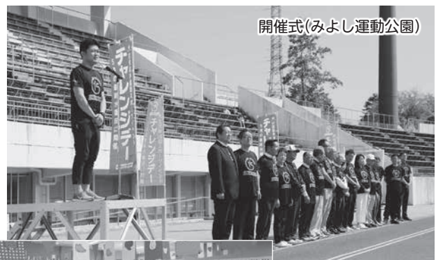
開催式(みよし運動公園)