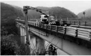
昨年度橋梁点検の状況

広島県では、県が管理する道路、河川、砂防などの土木施設について、施設の現状や損傷状況を把握するため、定期的に点検を実施しています。この点検により、施設の健全度を評価し、健全度評価に基づいた計画的な維持管理を行うことで、利用者の安全確保や施設の機能維持を図ります。