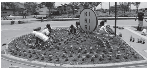
きりりの花壇を花いっぱい！(市民ホールきりり)