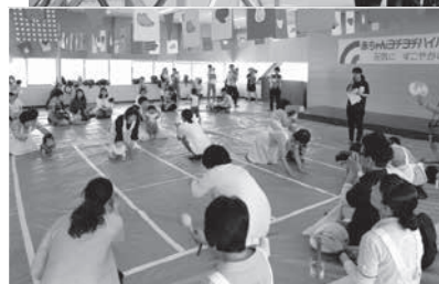
赤ちゃんヨチヨチ ハイハイ競争 (三次市福祉保健センター)