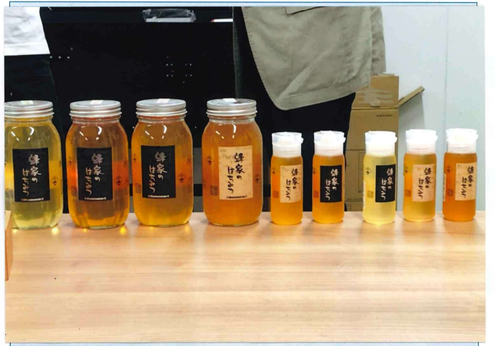
【こだわり抜かれた“本物の蜂蜜”たち】

株式会社Beemonteは、ミツバチの飼育(養蜂)から始まり、「本物の蜂蜜」を届けるという信条のもと丁寧に作られた蜂蜜の生産・販売、ミツバチのリース、販売などを主な事業として行っている。正しい養蜂のルールやマナーの普及活動にも力を入れている。