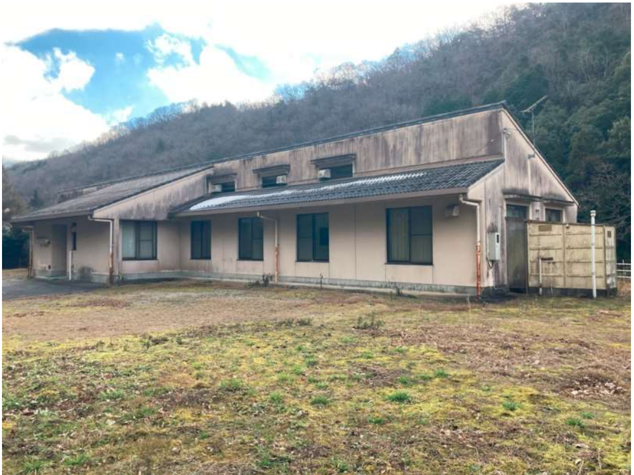
土砂災害警戒区域・土砂災害特別警戒区域