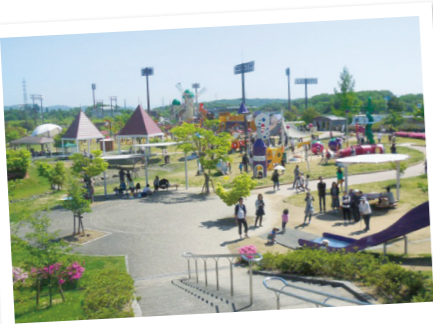
屋外大型遊具「みよしあそびの王国」