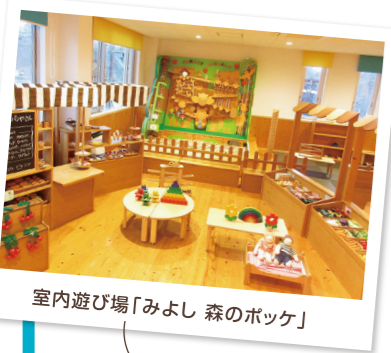
室内遊び場「みよし 森のポケット」