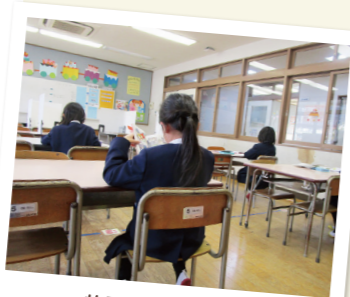
放課後児童クラブ