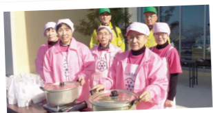
健康寿命の延伸、 子供の生きる力を育てる 食育の推進。