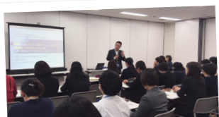
メンタルヘルスの啓発と 相談の充実。