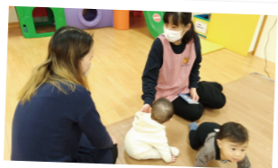
妊娠から出産・子育て期までの 健診・相談支援の充実。