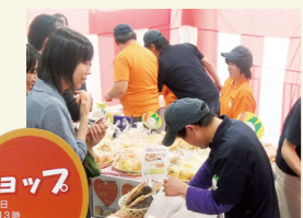
市役所内 での販売

障害者就労支援施設 製品の販路を 確保するための 取組です。 毎週水曜日の お昼に、 市役所内に 出店して います。