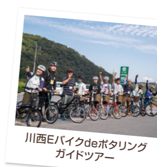
川西Eバイクdeポタリング ガイドツアー

一般社団法人三次観光推進機構と 連携して、体験型観光などの 資源開発に取り組んでいます。