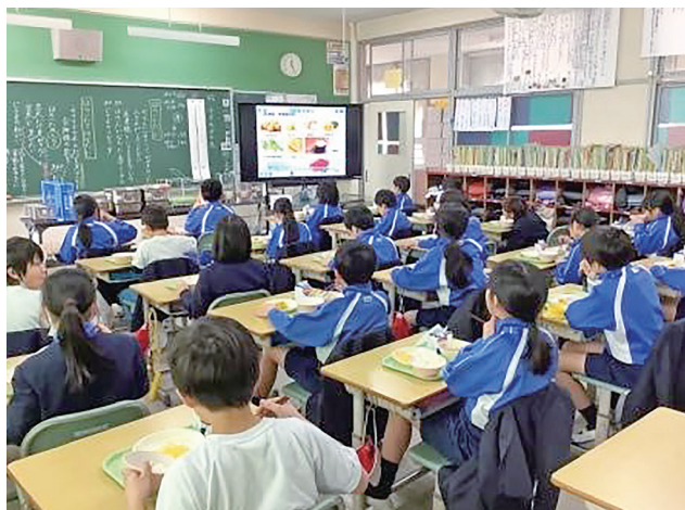
食育動画で学びながら♪

学校給食は、成長期にある児童・生徒の心身の健全な発達のため、栄養バランスのとれた食事を提供することにより、健康の増進、体位の向上を図るとともに、望ましい食習慣と食に関する実践力を養います。また、地場産の安全で安心な新鮮食材を取り入れ、地域の自然、食文化、産業等についての関心を高め、みんなで一緒に楽しく食べることで、好ましい人間関係を育てる場にもなります。三次学校給食センターと6か所の共同調理場（2か所の共同調理場は調理部門を委託）で、小学校21校（2,276人）、中学校12校（1,052人）の給食を提供しています。