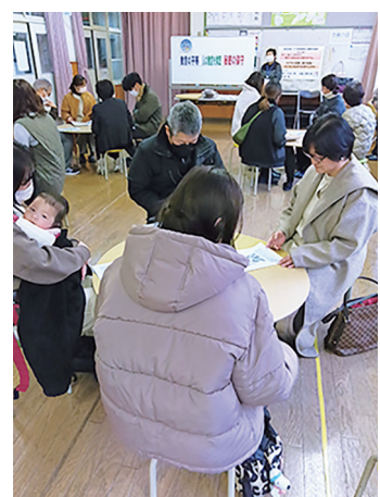
小学校「親プロ」講座