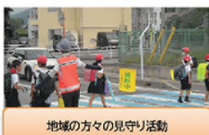
地域の方々の見守り活動