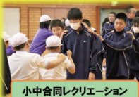
小中合同レクリエーション