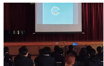
中学校「性と生を考える」