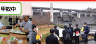
ふるさと甲奴「河川・水（防災）」の取組