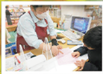
君田図書館との連携