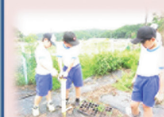
小童小の歴史調べ隊