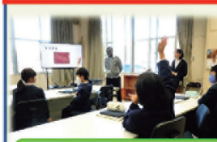
英語授業による小中連携