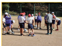
中学校教諭による出前授業