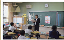
たんぽぽの権裁活動