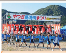
小・中学校合同での地域行事への参加