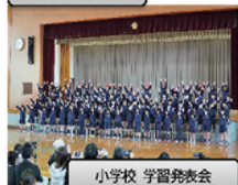
小学校 学習発表会