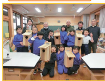
ブッポウソウの巣箱作り