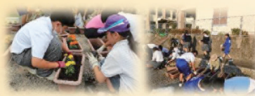
花植えボランティア