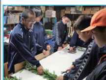
リンドウ農園体験学習