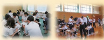
道徳教育の充実(小中合同研修)