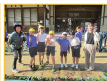
もっと花いっぱいさくぎ