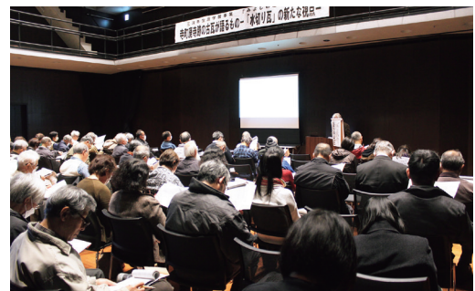
講演会「寺町廃寺前の古瓦が語るもの ～水切り瓦の新たな視点～」 (令和5年11月25日開催・参加者100人)

三次市歴史民俗資料館、吉舎歴史民俗資料館、三良坂民俗資料館等の指定管理による文化財や郷土資料の展示