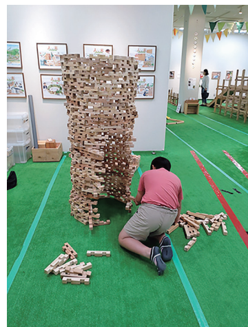
三良坂平和美術館 企画展「木のおもちゃにできること」

・三良坂平和美術館 学校団体鑑賞の受け入れ ワークショップ事業の実施 参加型平和への取組事業の実施