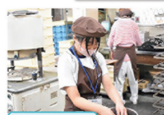
中学校 職場体験学習