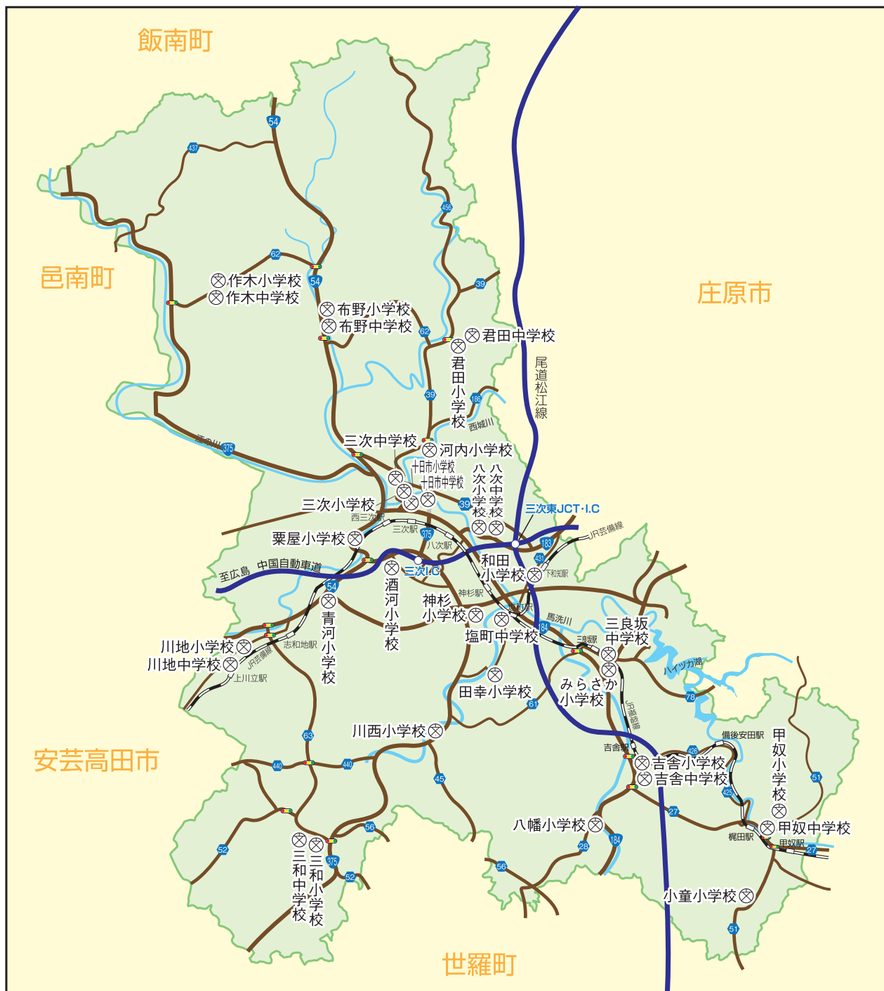
三次市立 小・中学校 位置図