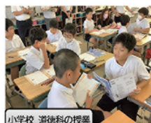
小学校 道徳科の授業