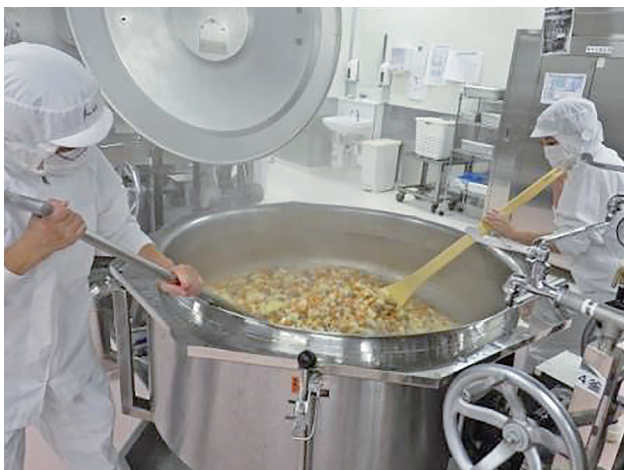
おいしい給食ができるよ！