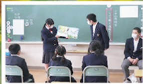
中学生による読み語り