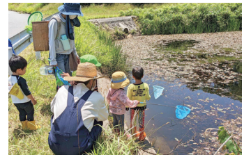
青少年体験活動 里山遊び