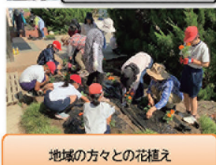
地域の方々と花植え