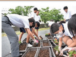
地域の方々と花植えボランティア