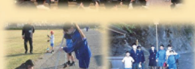
小中合同クリーン活動