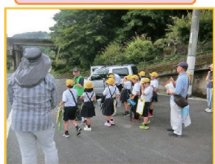
ブッポウソウの保護活動