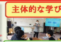
インターナショナルデー