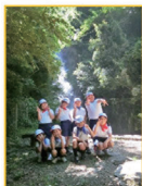
常清滝への校外学習