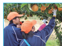
高丸農園体験学習