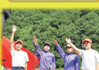
保小中合同運動会