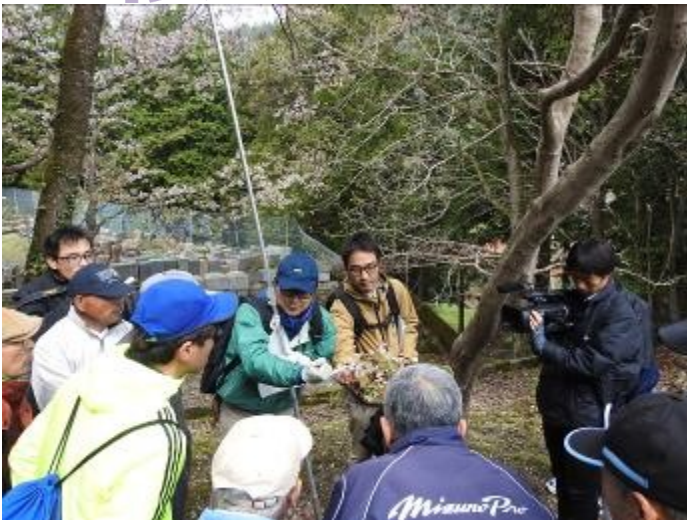
↑ 桜勉強会の様子。浅野神社付近。