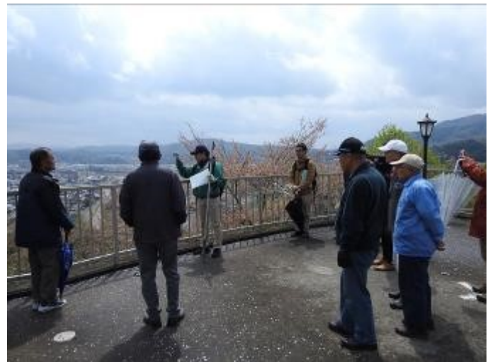
↑ 桜勉強会の様子。展望台にて。