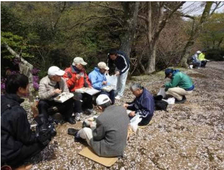
↑ ファンクラブの皆さん、食事中です。