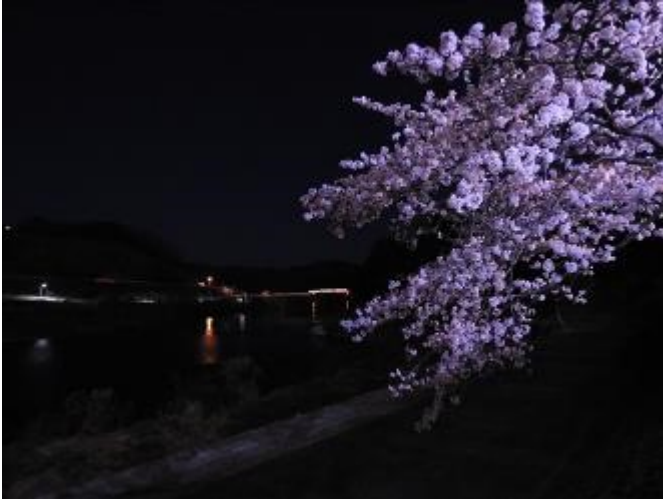
↑ 写真の真ん中に光っているのが三江線です。江津方面に向かっています。右手は桜土手です。