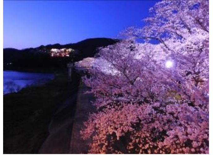
↑ 今年の桜土手の夜桜は特に綺麗に見えました！