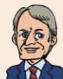
ジミー・カーター氏