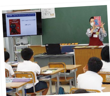
読書活動推進員による講座