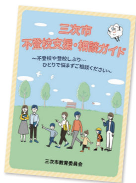
▲三次市不登校支援・相談ガイド