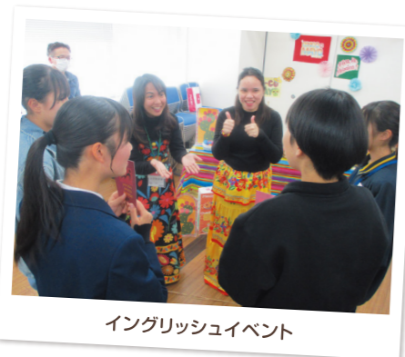
イングリッシュイベント