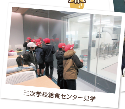
三次学校給食センター見学