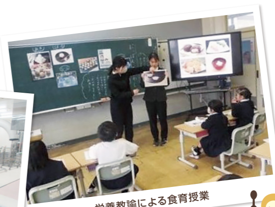
栄養教諭による食育授業