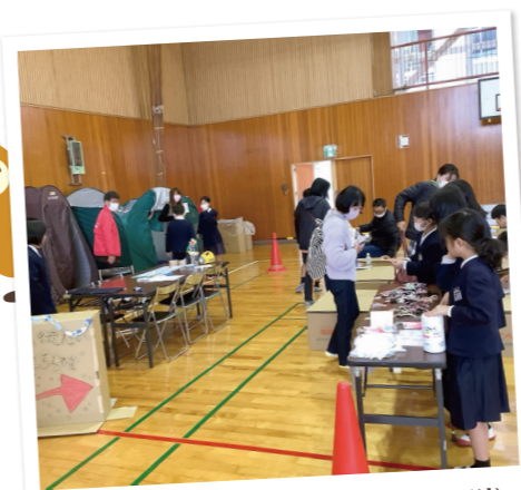
コミュニティ・スクール(模擬避難所【十日市小学校】)

地元の農産物を活用した「みよしふるさとランチの日」や「学校給食 食育推進事業」など、三次らしい学校給食を通して食育を推進しています。また、学校給食に対する理解を深めるため、三次学校給食センターでは市民対象の学校給食試食会や子どもたちの見学を受け入れています。