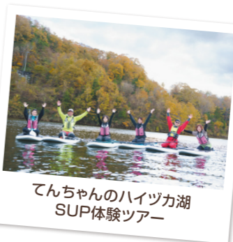
てんちゃんのハイヅカ湖 SUP体験ツアー

一般社団法人三次観光推進機構と連携して、体験型観光などの資源開発に取り組んでいます。