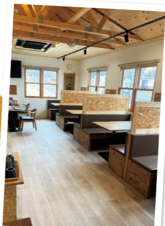
新規開業したカフェ