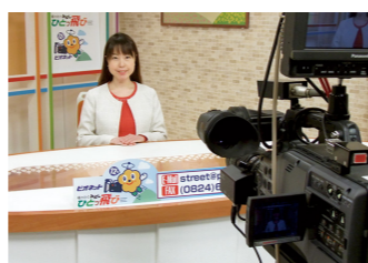
ケーブルテレビ収録の様子