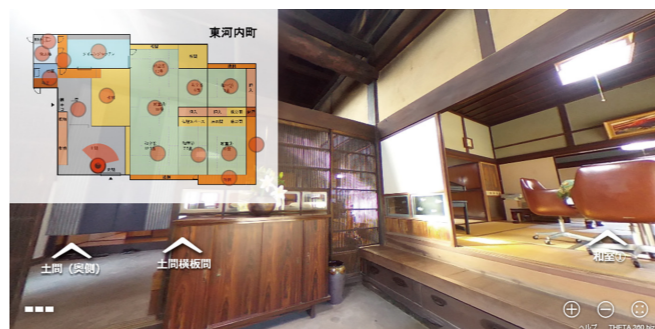
360°カメラによる物件内部紹介