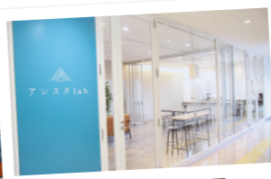
アシスタ lab. 入口