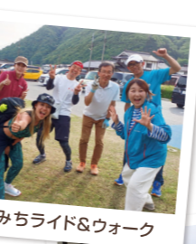
川西よりみちライド&ウォーク