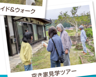
空き家見学ツアー