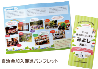
自治会加入促進パンフレット