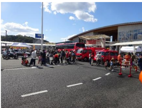
駅前メイン会場(消防車展示・バルーンアート)