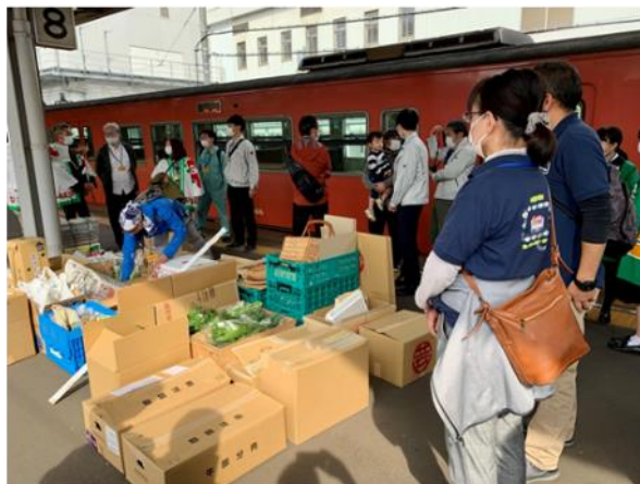
広島駅8番ホームに到着