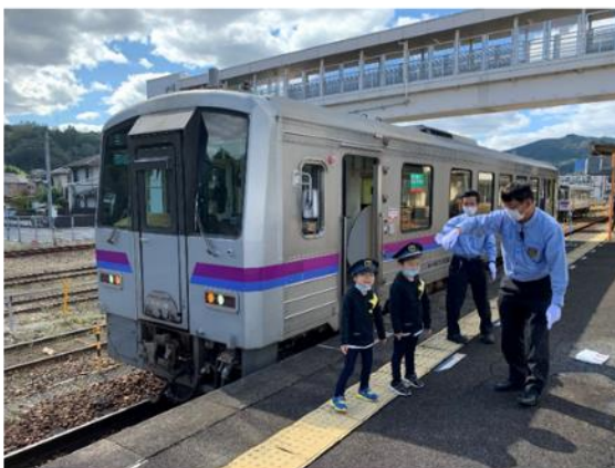
運転席添乗・放送体験