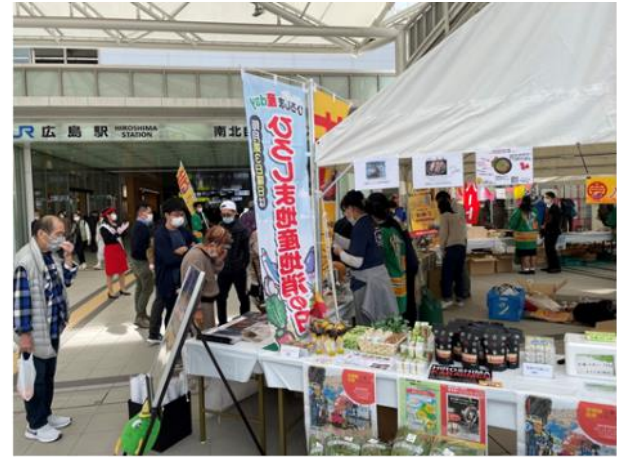
販売の様子 庄原市、三次市、安芸高田市、広島市の特産品を販売