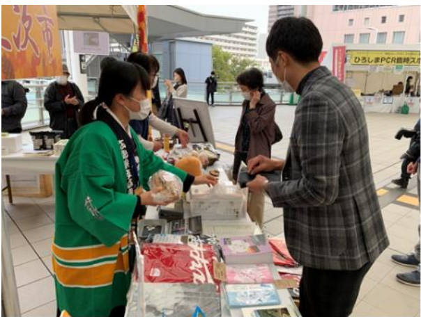
販売の様子 広島商業高校の学生も一緒に販売！