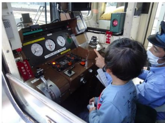
運転席添乗・放送体験