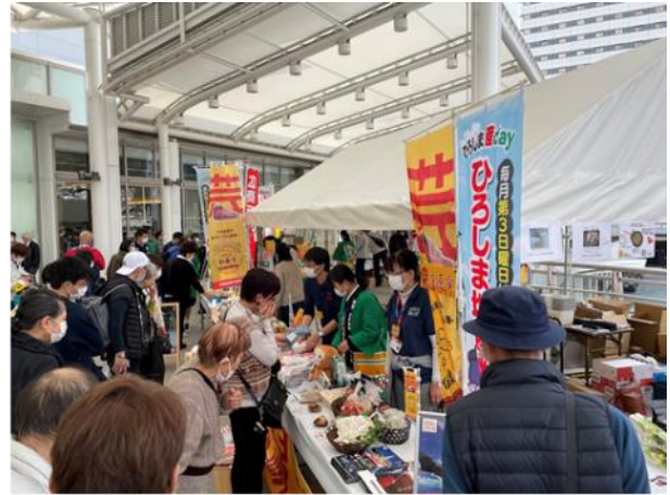
マルシェ会場の様子 特産品を求めめるお客様で賑わった