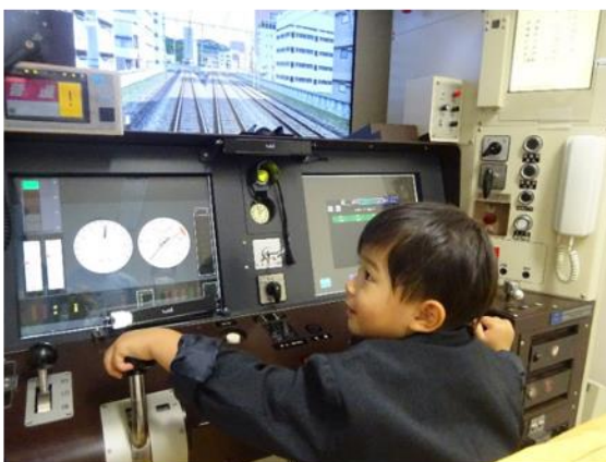
運転シミュレーター体験