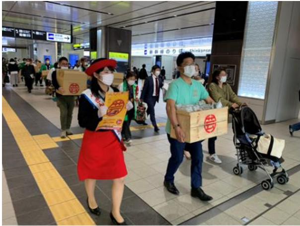
ホームからマルシェ会場に特産品を運搬 芸備線対策協議会会長を先頭にスタッフ全員で運搬