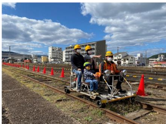
軌道自転車乗車体験