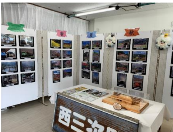
西三次駅模型展示・芸備線福塩線写真展