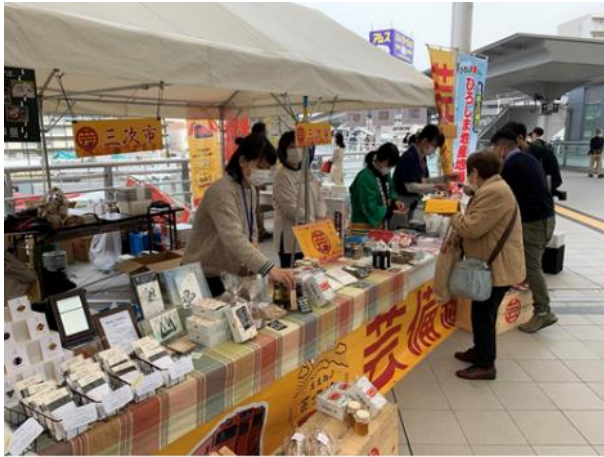
販売の様子 広島商業高校の学生と一緒に販売