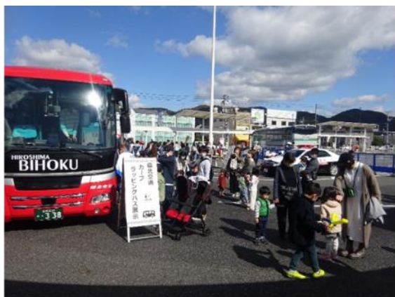
駅前メイン会場(バス・パトカー展示)