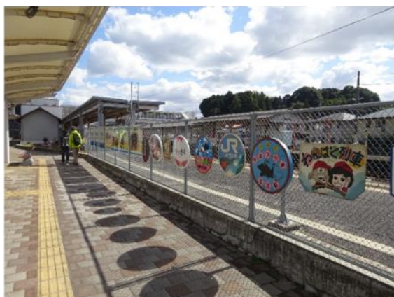
駅前メイン会場(三江線駅名板歴代列車ヘッドマーク展示)