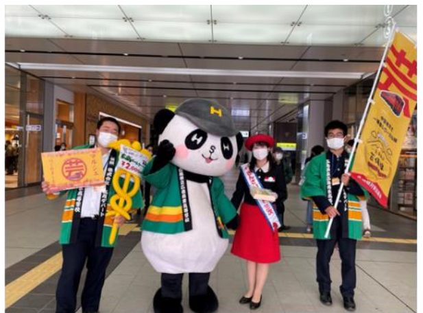
PRの様子 広商パートマスコットキャラクター「広デパンダ」と三次きんさいエイド