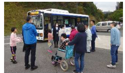
令和3年度 社会福祉法人あらくさ（甲奴町）