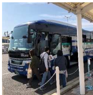
バス車両展示(運転席試乗)