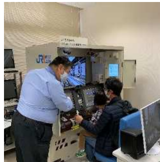
運転シミュレーター体験