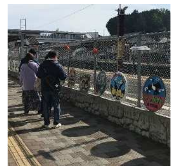
歴代列車ヘッドマーク展示