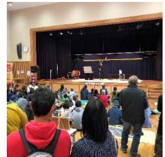
メイン会場(神楽・大道芸・マルシェ)