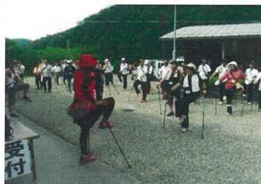
ノルディックウォーキング研修