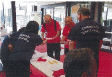
受付 各地区委員をお出迎え