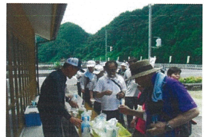
ウォーキングの給水ポイント