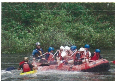
ラフティング研修

台風の影響で、カヌー研修が、ラフティング研修に変更になったものの、2種目の実技研修を行いました。