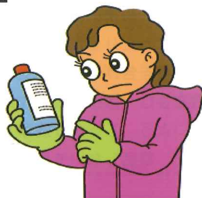
農薬ラベルを確認