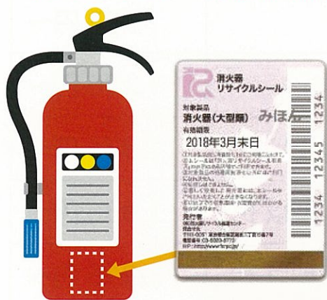
【リサイクルシール添付の例】

リサイクルシールについて 2009年以前に製造された消火器にはリサイクルシールの添付がありません。廃棄する場合には購入の上、添付してください。