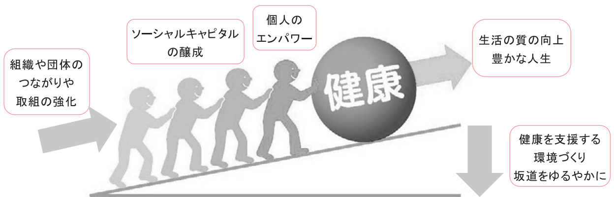
[ ヘルスプロモーションとソーシャルキャピタルのイメージ ]

上の図は、市民が自ら取り組む健康づくりを、人と人とのつながりや、地域の活動などソーシャルキャピタルの醸成による地域の力が支えらるとともに、健康づくりを行いやすい環境づくりを進めることで、市民一人ひとりの豊かな人生を実現することを表しています。