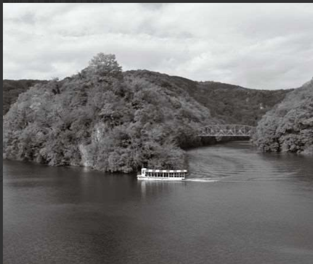
帝釈天遊覧船 冬季は運休

全長18kmの石灰岩渓谷で、日本百景の一つとして、また広島県を代表する景勝地としても知られており、国内有数の峡谷でもあります。神龍湖では、遊覧船が就航し、秋の紅葉が素晴らしい見応えです。