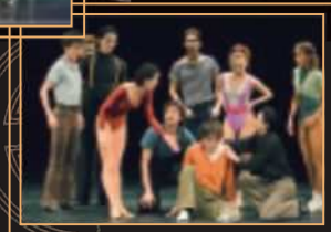
※写真はすべてこれまでの公演より