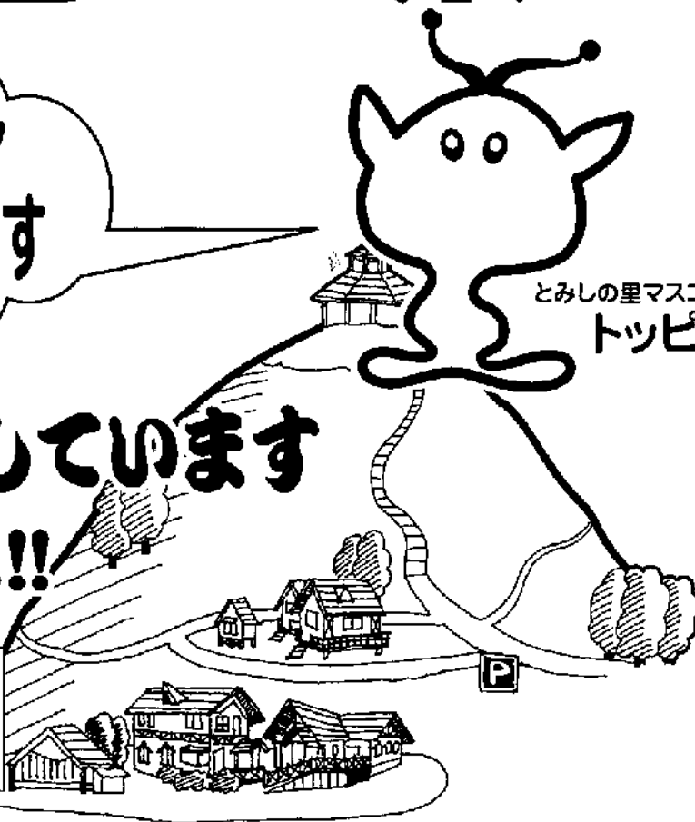
とみしの里マスコット トッピー