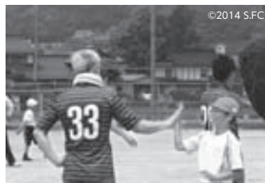
選手と児童によるミニゲーム

選手の皆さんと児童たちは、サッカーのミニゲームで対戦したり、給食を一緒に食べたりしながら交流し、校内はたくさんの笑顔と歓声であふれました。