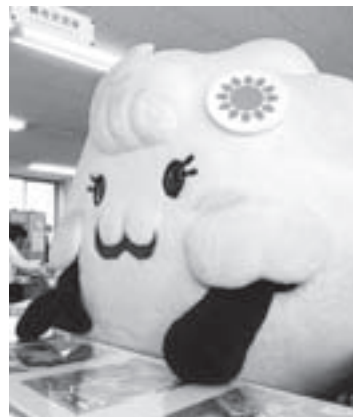
三次観光イメージキャラクター「きりこちゃん」

三次の霧の海をモチーフにした、霧の海から生まれた女の子。三次銘菓「泡雪」のように真っ白で、前髪は三次の三本の川をイメージしたヘアスタイル。ふわふわにこにこしている優しい子で、きんさいエイド三次(市の観光アシスタント)になることを夢めている。 平成23年12月18日に誕生し、平成24年5月3日に6番目の三次観光サポートスタッフに任命。