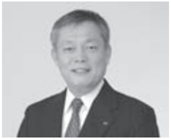
浦邊代表取締役社長