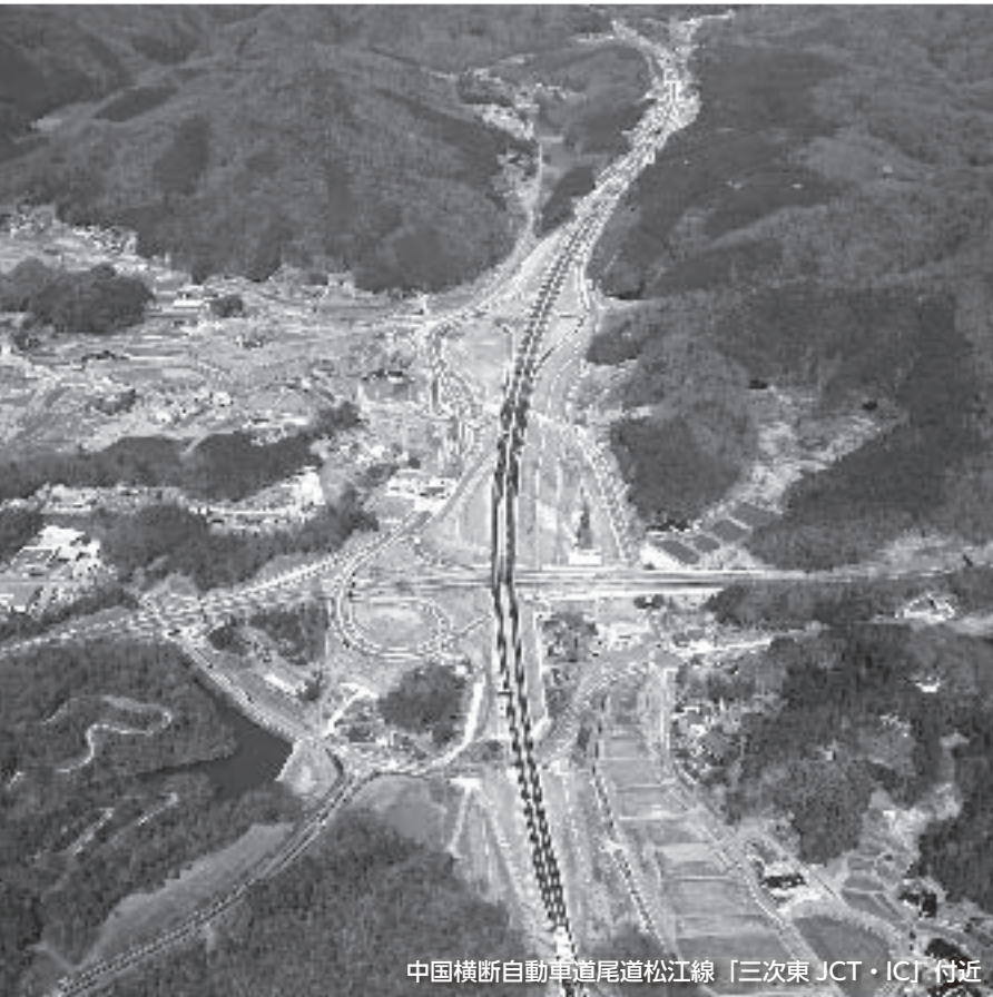
中国横断自動車道尾道松江線「三次東 JCT・IC」付近

広島県と島根県の9つの市町をつなぐ全長約137 kmの中国横断自動車道尾道松江線。平成26年度中に、残る世羅IC・吉舎IC間が整備され、いよいよ全線開通を迎える予定です。 三次市では、この機会を、さらなる観光客数増加に向けたきっかけにしようと、オール三次観光推進戦略に沿って、オール三次観光プロジェクトをはじめ、様々な取り組みを展開しています。 今回は、尾道松江線全線開通まで1年を切った今、市内の観光施設ではどのような取り組みが進められているか、市の取り組みとあわせて紹介します。