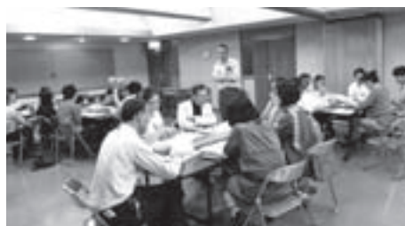
実行委員会会議の様子

プレイベント実行委員会では、市民ホールの運営を市民がボランティアで支える仕組みを検討しています。全国的にも、市民が積極的・主体的に関わることで、舞台芸術関係者から高い評価を得ている文化施設がたくさんあります。三次市民ホールもそれをめざしています。