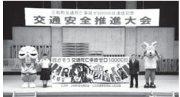
三和中学校の生徒がデザインした交通安全啓発看板

三和町が6月4日(水)で交通死亡事故ゼロ5000日(約13年9カ月)を達成し、これを記念して交通安全推進大会が開催されました。大会では、保育所、小・中学校や町内事業所が、これまでの地道な交通安全の取り組み事例を発表し、今後、8000日・10000日と、記録を伸ばす努力を町民一丸となって行うことを誓い合いました。