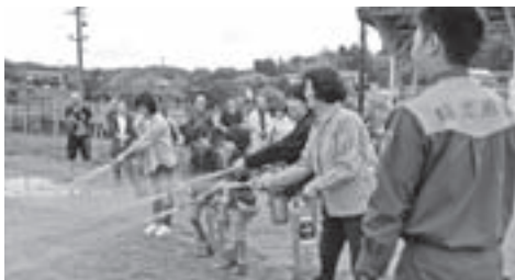
和田地区内での避難訓練の様子

「備え」に決して終わりはありません。市民、自主防災組織、協定先など、それぞれの皆さんと市がしっかりと連携をとって、「みんなで高める」領域の防災、減災の推進を実現しなければなりません。 さらに市でも、多くの自治体や各種団体と災害時の応援や協力の協定を結び、「備え」をしています。4月には、大歩危、小歩危などが有名な徳島県三好市と災害時相互応援協定を締結しました。災害が起こった時に、お互いに食糧・飲料水や生活必需品を送ったり、職員を派遣したりする協定で、地理的に離れ同時に被災する可能性が低いため、万が一の時に有効的であるとの考えからです。また、先日は広島県LPガス協会備北地区協議会と、災害時に被災者へガスボンベなどを優先的に提供していただく協定を結びました。 「備え」に決して終わりはありません。市民、自主防災組織、協定先など、それぞれの皆さんと市がしっかりと連携をとって、「みんなで高める」領域の防災、減災の推進を実現しなければなりません。