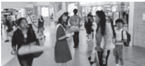
平成 25 年 6 月 19 日 広島駅でのキャラバン