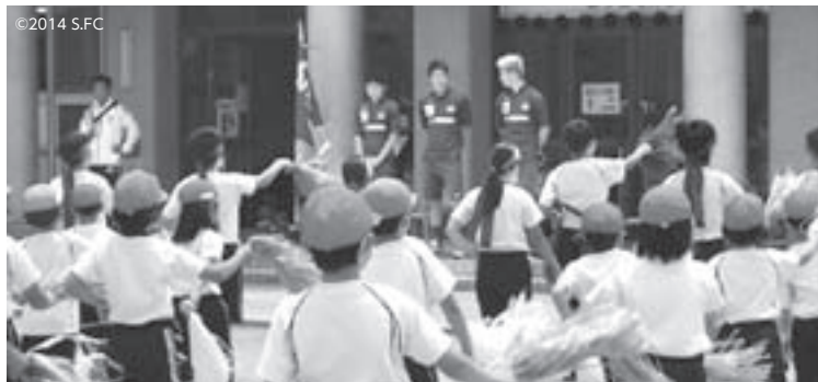
開会式(児童によるおもてなし)