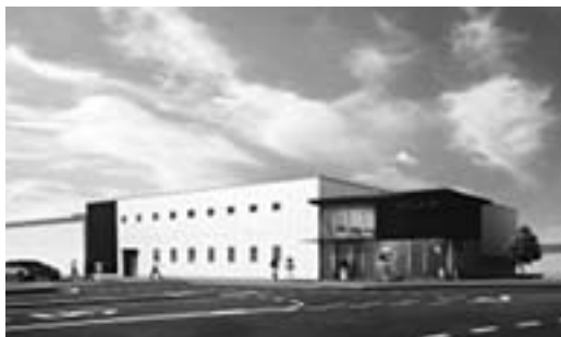
三次駅完成予想図(提供: JR西日本)

三次駅周辺整備事業の中でJR西日本が施工している新駅舎工事が着々と進んでいます。今後、既存駅舎の解体、新駅舎の工事が始まり、来春には新駅舎が完成します。工事中は駅前スペースが狭くなり、大変ご不便をおかけしますが、ご理解、ご協力をお願いします。