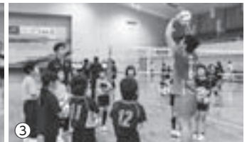
①豪快なデモンストレーション ②③熱心に指導を受ける参加者